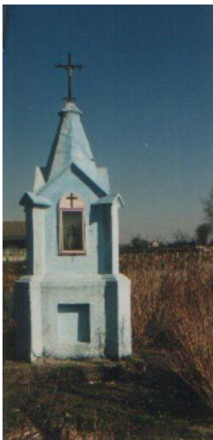
Na chwilę obecną w miejscowości Szczebłotowo brak jest obiektów wpisanych do rejestru zabytków oraz obiektów objętych ochroną konserwatorską.