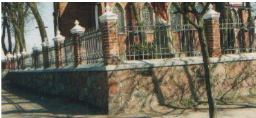
Byczyńie XIX/XX wiek