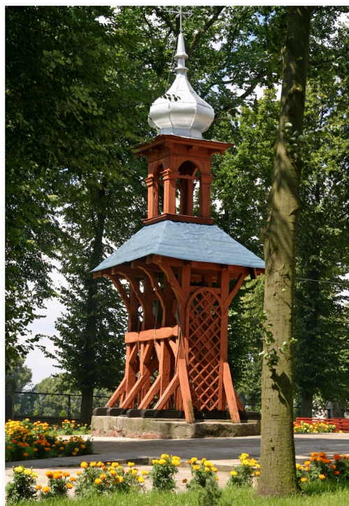
Krzywosądz - Neogotycką dzwonnica rok b. 1861

Jest to budowla neogotycka drewniana, o konstrukcji zrębowo-słupowej na fundamencie granitowym. W południowo-zachodnim narożu znajduje się głaz z wyrytą datą 1861. Prezbiterium dwuprzęsłowe, z objętymi bryła korpusu przybudówkami po bokach, ponad którymi znajdują się łoże kolatorskie. Korpus kościoła trójnawowy pseudohalowy, z przybudówką na osi mieszczącą kruchtę. Okna i przeźrocza nad wejściami ostrołukowe. Dach kryty blachą. Od wschodu czworoboczne wieżyczki, od zachodu nadbudowana kwadratowa wieża. Kruchta zakończona ażurową balustradą. Ołtarz główny, ambona, chrzcielnica i ławy kolatorskie z herbem Tępa Podkowa. W lewym bocznym ołtarzy obraz św. Antoniego z Dzieciątkiem, barokowy z XVII wieku, ponadto monstrancja barokowa z połowy XVIII wieku z cechą miejską Torunia, gotycki kielich z XV wieku. 5