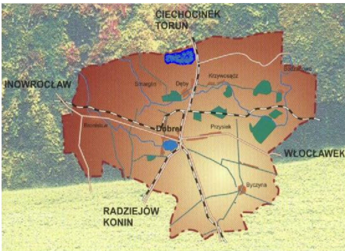
Mapa 2. Mapa Gminy Dobrze.