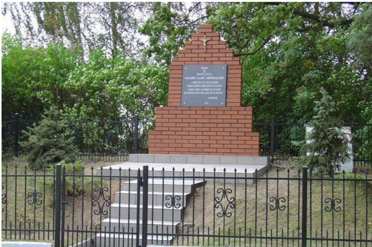
Pomnik w Krzywosądzy przy drodze do Bodzanowa

Poległym za wolność, Całość, Niepodległość niech żywi nie tracą nadziei i przed narodem niosą oświaty kaganiec, A kiedy trzeba, na śmierć idą po kolei jak kamienie przez Boga rzucające na szaniec, J. Słowacki 1916r.